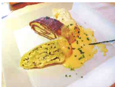
Štrukljeva trojka: ajdovi, sirovi, drobnjakovi