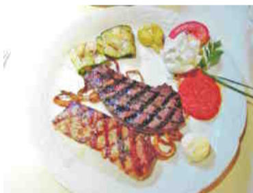
Žar z vzorcem in vonjem: telečja jetra in svinjska riba