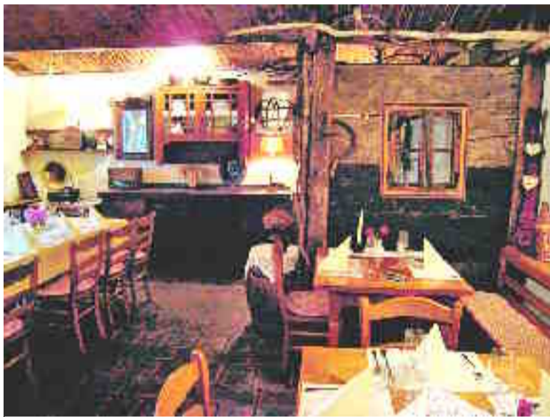
Stara slovenska gostilna, čeprav ima šele trideset let

Hišna pašteta in kajmak s pogačko. Po slovensko se pogački reče, da prevedem, lepinja ... Četudi pogreta, sveže hrustlja in se nevarno trga. Po pogački je ob narezku iz hišnih