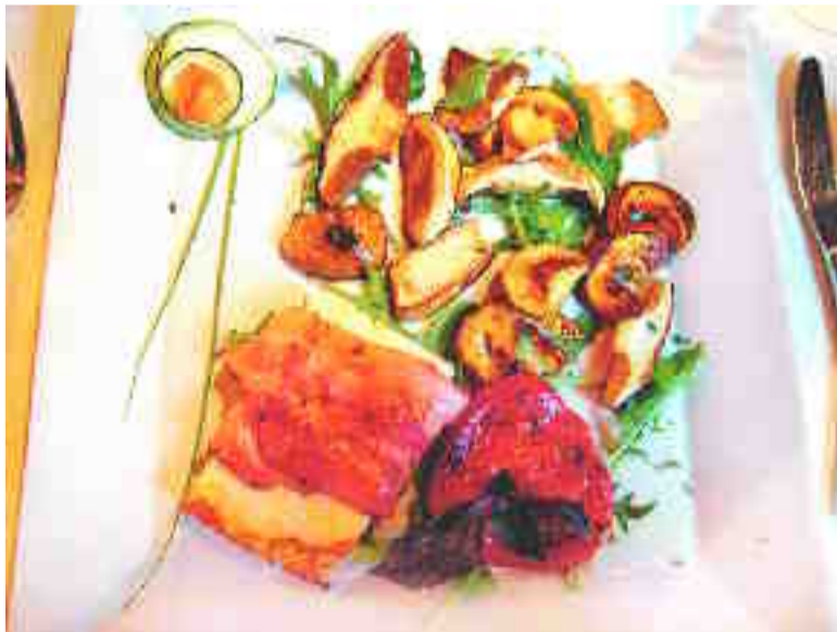
Uvod z žara: jurčki in mladi kravji sir